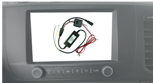
Radio nicht im Lieferumfang enthalten

Interface für Ford Trucks F-Max zum Anschluss von Rückfahr- oder Frontkameras