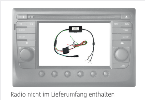
Radio nicht im Lieferumfang enthalten

Kameraanbindung an das DAF TNR LKW Navigationsradio